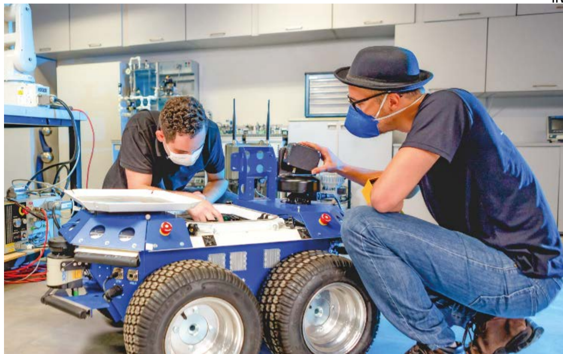
O CURSO será ministrado em Ouro Preto (MG)

Instituição privada de ciência, tecnologia e inovação sem fins lucrativos e mantida pela Vale, o Instituto Tecnológico Vale pesquisa soluções tecnológicas e científicas para os desafios da cadeia da