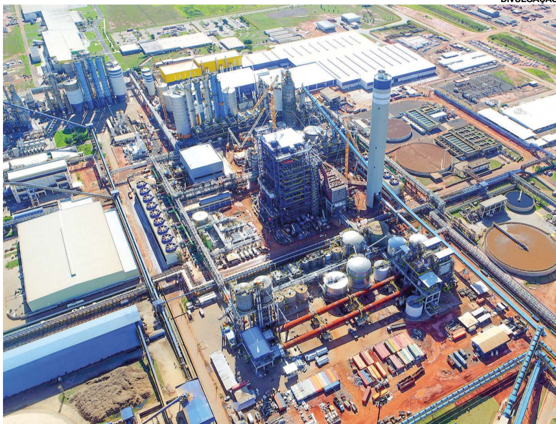
VISTA AÉREA da Suzano Unidade Aracruz (ES)

A sustentabilidade é parte essencial do negócio da Suzano, que se comprometeu publicamente com um conjunto de 15 metas de longo prazo, os chamados "Compromissos para renovar a vida". Entre elas está o objetivo, anunciado em 2021, de conectar um total de 500.000 ha de áreas prioritárias para a preservação nos biomas Cerrado, Mata Atlântica e Amazônia até 2030.